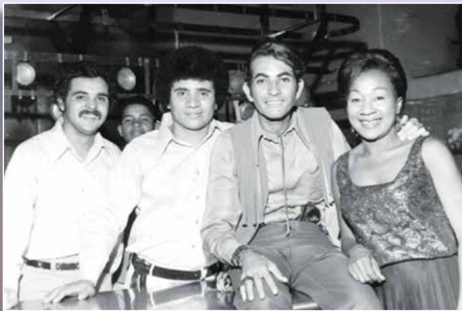
Ricardo Ray, Bobby Cruz, Cheo Palmar y Canelita Medina

Una figura reconocida mundialmente en el mundo de la música, a quien jamás se le ha visto en ningún acto, que pueda manchar o enlodar su impecable carrera. Canelita Medina, con su sencillez, con su personalidad con su espíritu de lucha y sus triunfos, ha logrado hacerse merecedora del respeto y la admiración, por parte de la comunidad musical y del público latinoamericano, por ello es uno de los personajes a quien dedicamos estas páginas por ser una pieza valiosa de nuestra historia.