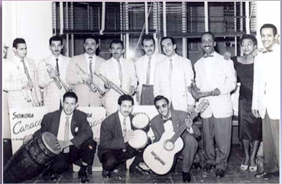
La Sonora Caracas

Con La Sonora Caracas va a permanecer 7 años, teniendo la dicha de haber participado junto con Celia Cruz en el gran mano a mano, celebrado entre La Sonora Matancera y La Sonora Caracas, realizado en el Teatro Libertador de Puerto la Cruz, siendo ellas las vocalistas de ambas orquestas.