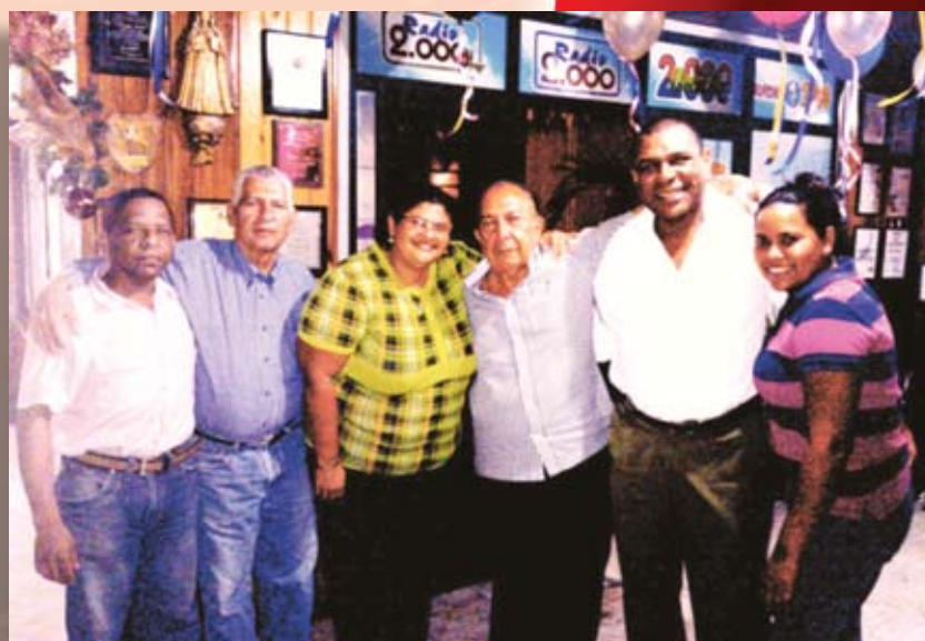
Personeros de Radio 2.000 compartiendo en familia