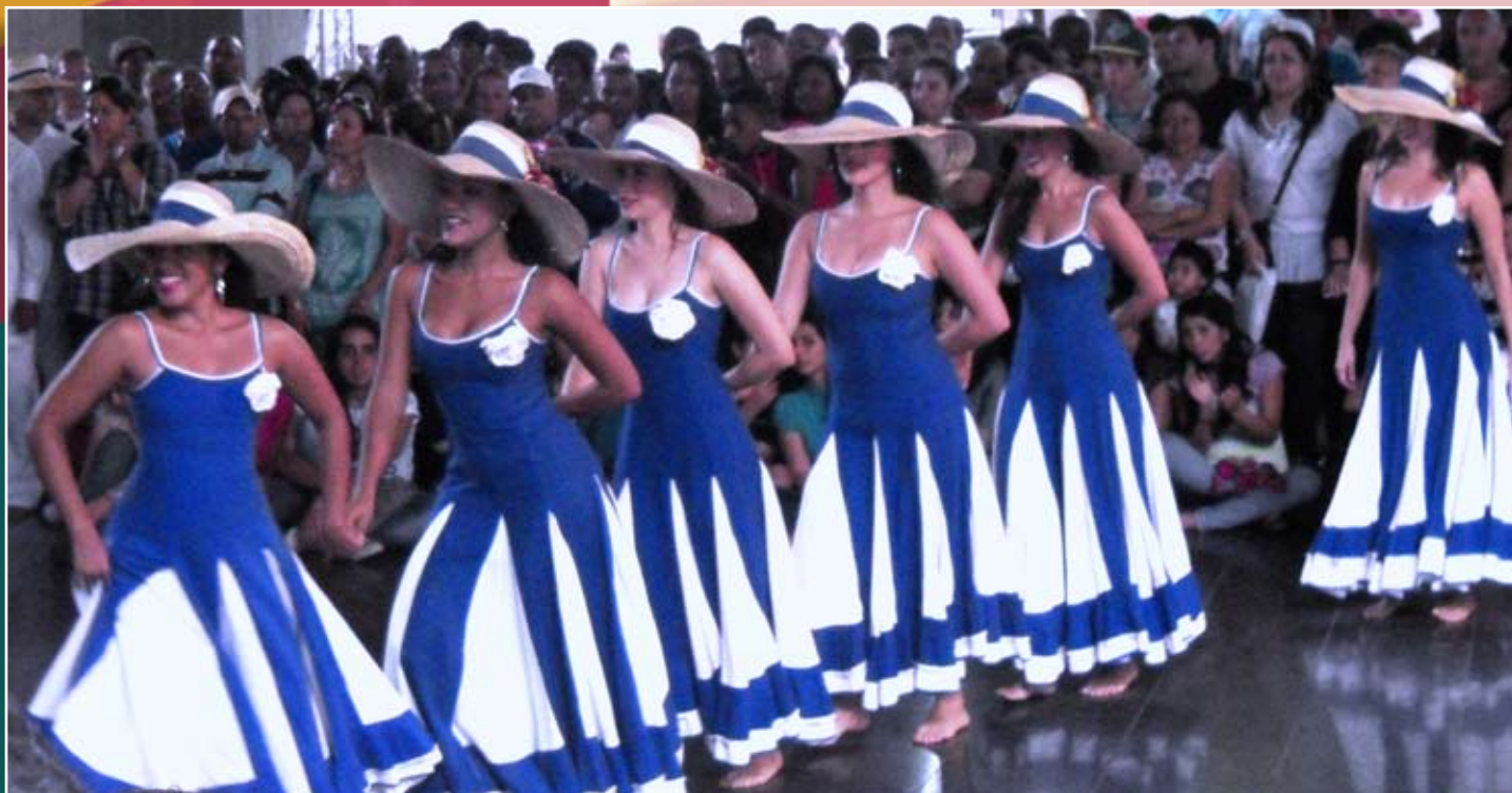
Grupo de Danzas de Los Vasallos del Sol.

Con una muestra de la Industria Discográfica que es la Memoria Sonora del País, AVINPRO participó en la primera Feria de la Música “Venezuela Disco 2012”, en las instalaciones que para ello fueron acondicionadas en el Teatro Teresa Carreño, igual hizo la Sociedad de Autores y Compositores de Venezuela SACVEN con un stand de obras de grandes creadores