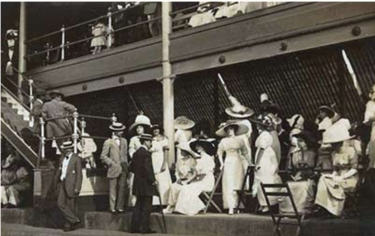
Hipódromo de Sabana Grande