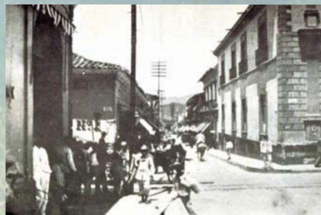
Gradillas a Sociedad

Muchas de estas familias que conformaban la sociedad caraqueña, se mudaron de inmediato, cuando comenzaron a construir una nueva urbanización en el valle de Caracas, llamada el Paraíso. Fueron las primeras viviendas antisísmicas que se construyeron en la capital.