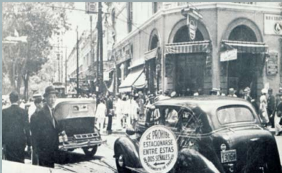
Al fondo la esquina de Padre Sierra

De Muñoz a Solís estuvo la casa de la Fuente. En la esquina de