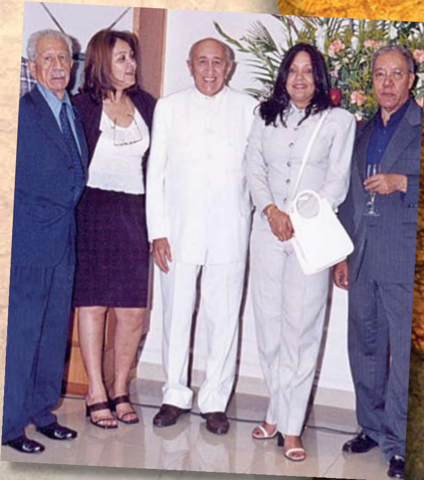
La foto corresponde a la inauguración de la Exposición "La Industria Discográfica Memoria Sonora del País", una de las actividades culturales, realizadas en Avinpro.

¡Maestro brindo por ti! ¡Por ti brindo Simón Díaz!, Que eres ejemplo en tu patria tu patria, la patria mía.