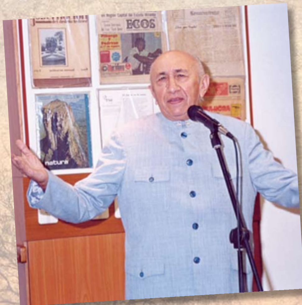
Simón Díaz, en Avinpro, dirigiéndose al público el día del Periodista.

El pasado miércoles 12 de Noviembre en el Hobby Center Fort he Performing Arts en Houston, el maestro Simón Díaz Como un homenaje a su obra, recibió el Grammy Latino, junto a otras figuras de la música en una ceremonia especial de antesala, a lo que fue la entrega de los Grammy correspondiente a su edición 2008.