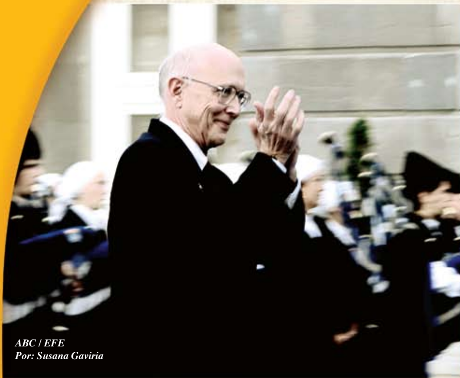
Por: Susana Gaviria

MADRID. El efecto Abreu todavía se deja sentir. Aun esta reciente el premio que ha recogido en Oviedo, el Príncipe de Asturias de las Artes, concedido al Sistema de Orquesta Infantiles y Juveniles de Venezuela, que este economista y compositor puso en marcha hace 33 años. Ahora, el homenaje toma otra forma no material y sí musical. Se trata de una gira de conciertos auspiciada por la Fundación Saludarte, con sede en Miami y en Madrid, en coordinación y colaboración con varias instituciones españolas e internacionales, como el Ministerio de Cultura, a través del Instituto Nacional de las Artes Escénicas y de la Música (Inaem) y una de sus unidades, la Joven Orquesta Nacional de España (Jonde); Juventudes Musicales de Madrid, y la Dirección General de Instituciones penitenciarias.