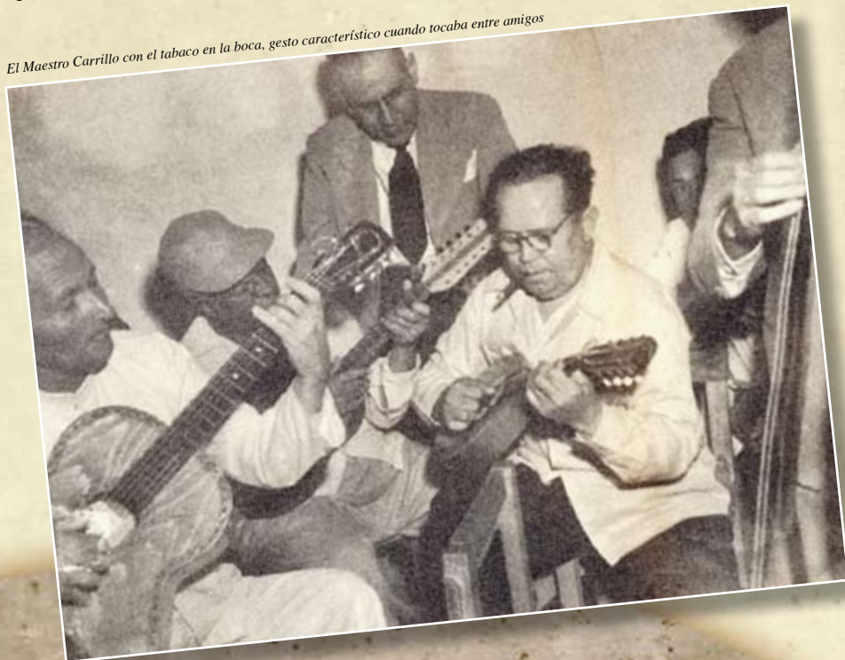
El Maestro Carrillo con el tabaco en la boca, gesto característico cuando tocaba entre amigos

El Maestro concebía la música tal como la soñaba, por ello, no le gustaba que le pusieran letra a sus composiciones