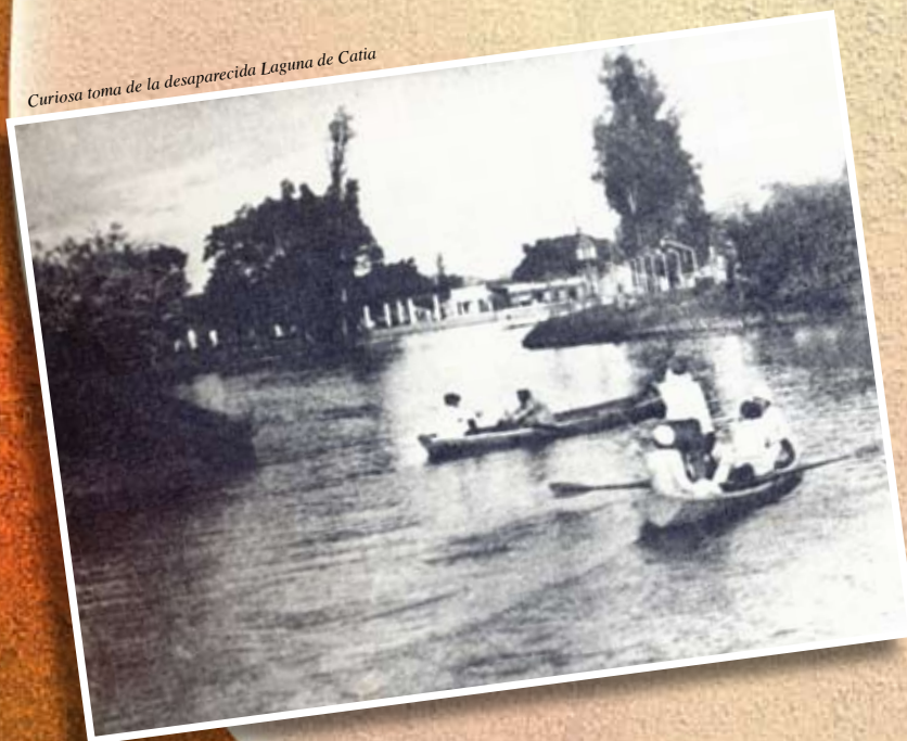
Curiosa toma de la desaparecida Laguna de Catia

La laguna rodeada de grandes sauces llorones, fue rellenada años después, dando paso al modernismo.